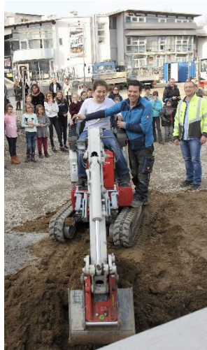
Beginn der Bauarbeiten