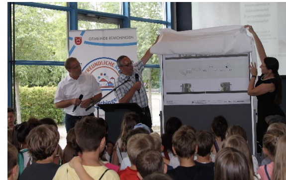
Präsentation der fertigen Pläne