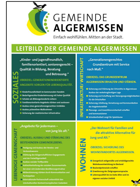
Leitbild der Gemeinde Algermissen