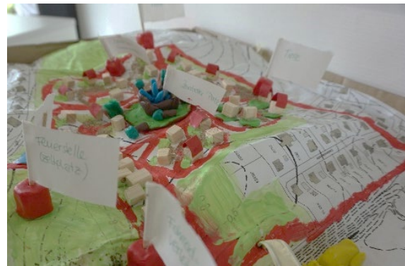
Beteiligung B-Plan Wedemark