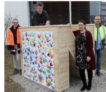
Der erste fertige Buchstabe