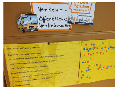
Befragung Mobilität Potsdam