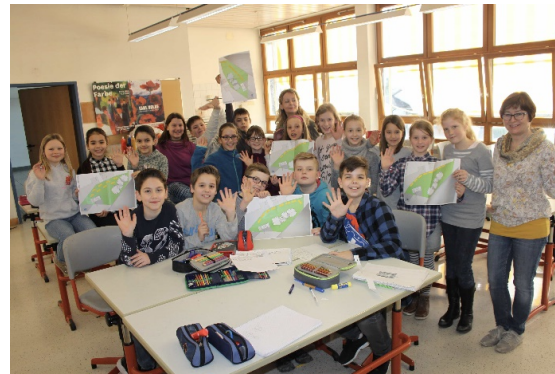
Schüler_innen entwickeln gemeinsam Ideen